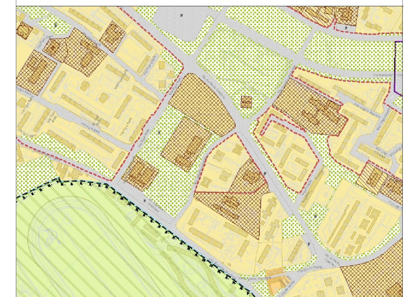
ESTRATTO P.G.T. (Tav. R02_1C) 1:5000